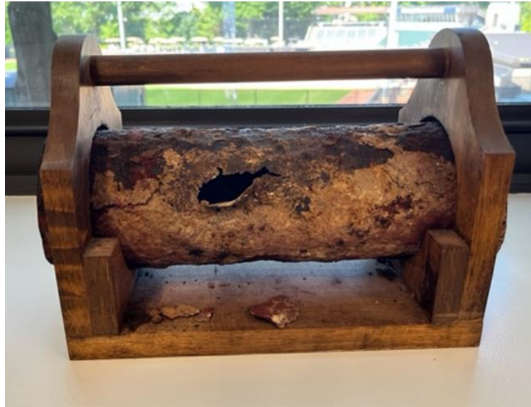
Tubo de Vapor Viejo