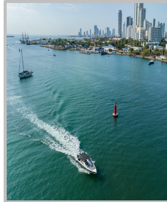
Bahia de Cartagena