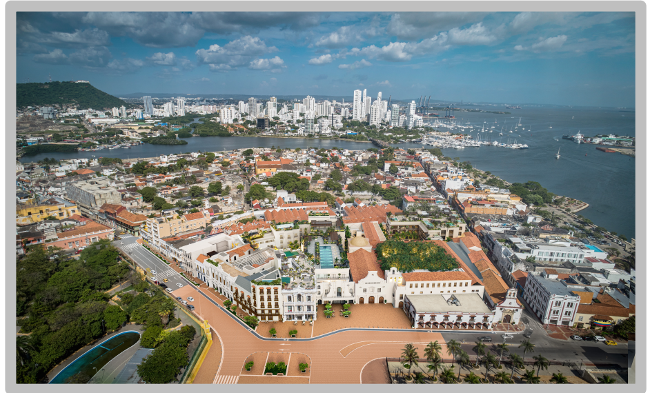
Hotel Four Seasons Cartagena